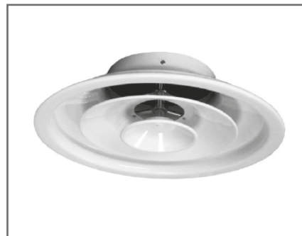
Article famille : EEB