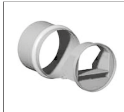
Article famille : FEA